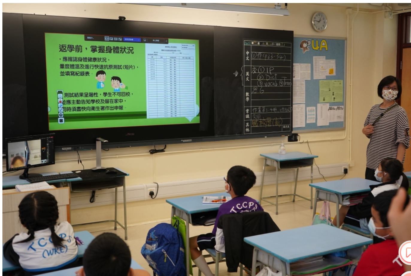
▲ 學校設立2周生命成長課，教導學生要有責任感。

為準備學生復課，學校在假期期間都有準備，給予學生一些課本以外的學習任務，提升他們自主學習的能力，例如請學生在家中幫忙煮餸、學英文打字、做家務等等，亦希望透過這些學習，學生能夠提升自理能力，彌補疫情停課對學生個人成長的影響。