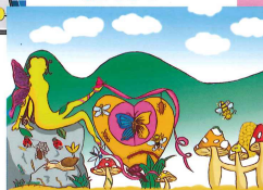
5A 李慧貞 美麗大自然 (獲全港冠軍)