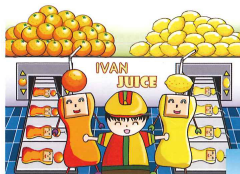
4A 劉俊超 未來果汁廠 (獲全港冠軍)