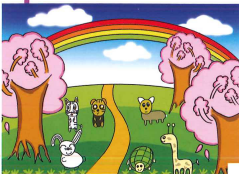
4A 葉文希 路邊的櫻花樹