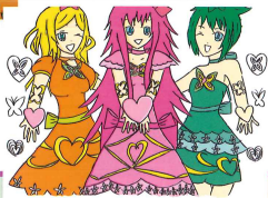
5B 劉穎怡 三位仙子