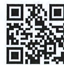
個人報名 Google Forms

填妥的申請表拍照 WhatsApp 至 (852)5401 2780 或 電郵至 info@kpge.org