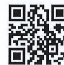
學校/團體報名表格